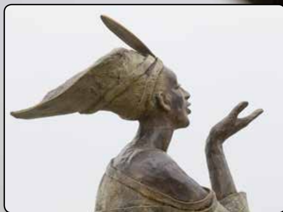
Achtergrond: 'Reach' Van boven naar beneden: 'De grote sjamaan', 'What's on my mind', 'Balancing my course' en 'Adem'