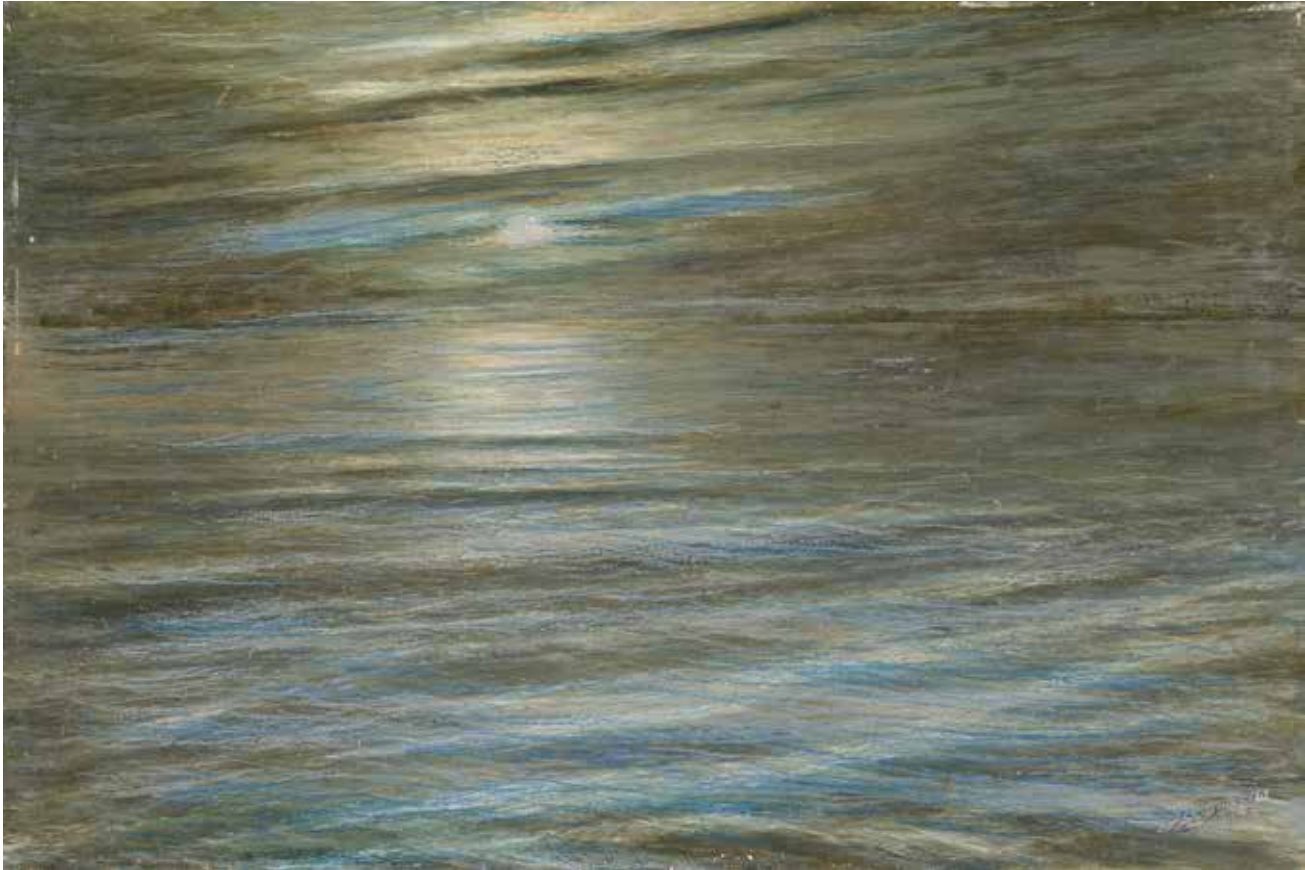
'Vloeiend licht', 1962

meer kunstenaars te doen. En hij schilderde ook doodleuk een schilderij over, hij bewerkte het als het ware opnieuw. Hij heeft een paar andere thema's geschilderd, ik ken daar twee schilderijen van, maar de meeste mensen vinden daar niks aan. Zijn ware ziel ligt in deze zeegezichten.'